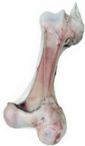
CANILLAS BEEF SHINBONES cod. 29002