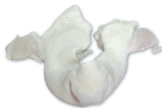
MORRO BEEF SNOUT cod. 28007