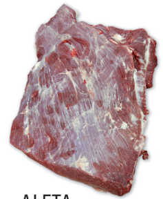
ALETA BEEF BRISKET BONELESS cod. 82064