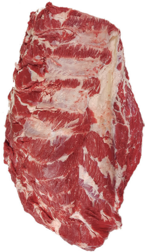
AGUJA BEEF NECK BONELESS cod. 82062