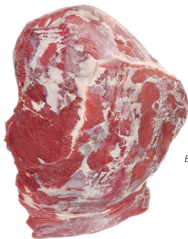
TAPA BEEF TOP SIDE cod. 82054