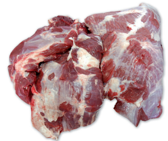
CARNE MAGRA BEEF LEAN TRIM cod. 82065