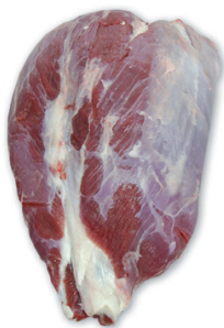
CULATA CONTRA BEEF HEEL cod. 82057