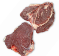
CARRILLADA BEEF CHEEKS cod. 28020