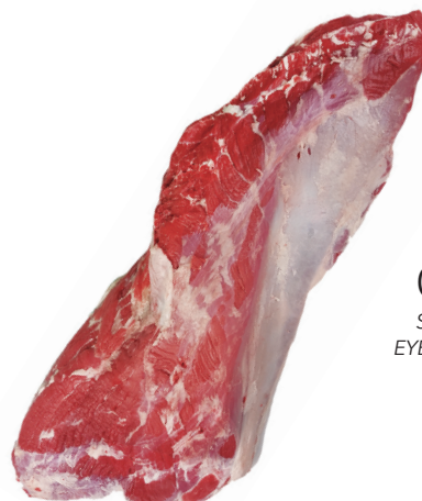
CONTRA SILVERSIDE, EYE-ROUND OFF cod. 82055