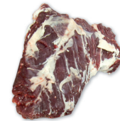
FALSO SOLOMILLO BEEF THICK SKIRT cod. 28027