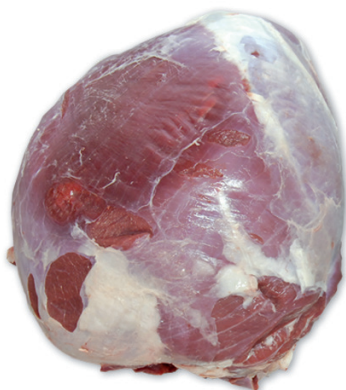
BABILLA BEEF THICK FLANK cod. 82052