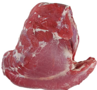
CADERA BEEF RUMP cod. 82053