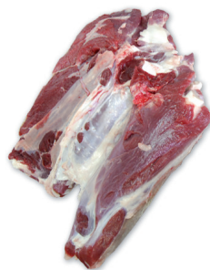
MORCILLO BEEF SHANK BONELESS cod. 82059