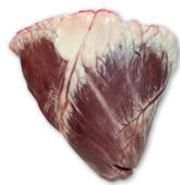
CORAZÓN BEEF HEART cod. 28011