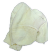
CALLOS BEEF TRIPE cod. 28005