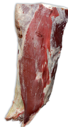
FALDA FLANK cod. 82012