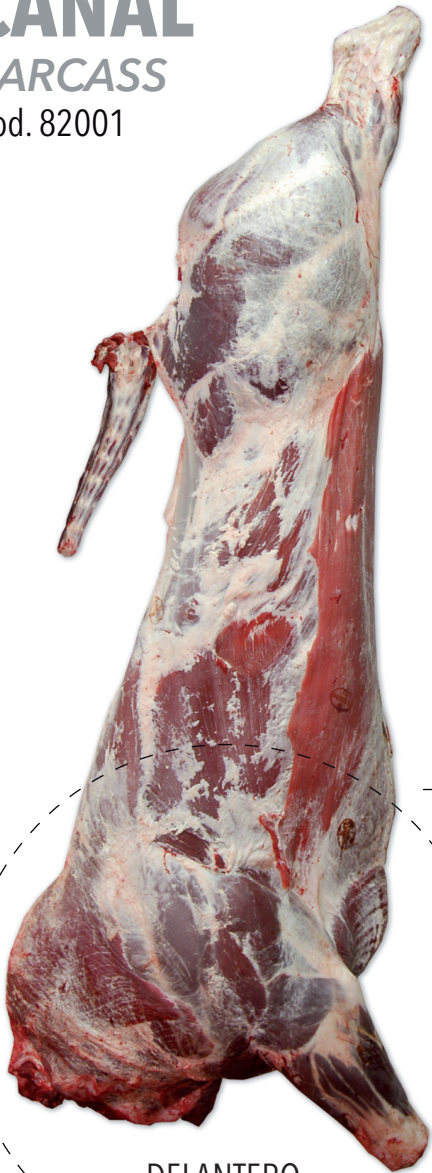
DELANTERO FOREQUARTER cod. 82009