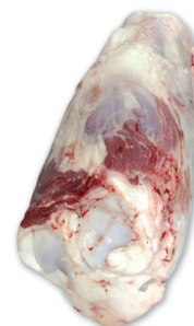
OSSOBUCCO OSSOBUCCO cod. 80058