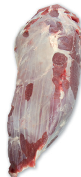
REDONDO BEEF EYE-ROUND cod. 82056