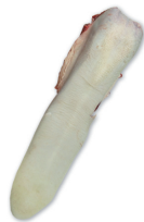
LENGUA BEEF TONGUE cod. 28004