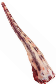
RABO BEEF TAIL cod. 28035