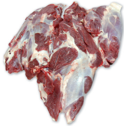
ESPAJDILLA BEEF SHOULDER BONELESS cod. 82063