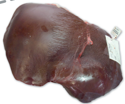
HÍGADO BEEF LIVERS cod. 28003